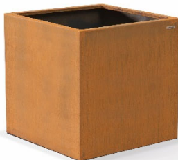
Pflanzkübel 800 mm