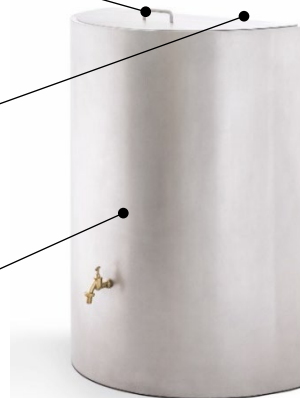
Regentonne HALBRUND in Edelstahl mit Rotex-Schliff

Deckel mit Edelstahlgriff Anschluss IG3/4", vorbereitet zum Befüllen mit Regensammler (auf Rückseite) Variante mit Aussparung für Fallrohr Wasserhahn-Auslass, z.B. für Gießkanne Tonne mit Innenbeschichtung für sauberes Wasser Zugangstür mit Lagerplatz, z. B. für Gießkanne (Option)