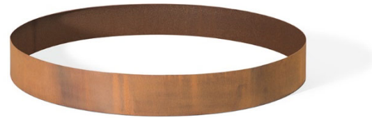
Pflanzring RONDA MASSIV*)