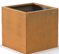
Pflanzkübel 600 mm