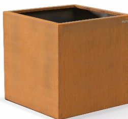
Pflanzkübel 800 mm