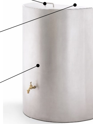
Regentonne HALBRUND in Edelstahl mit Rotex-Schliff

Deckel mit Edelstahlgriff Anschluss IG3/4", vorbereitet zum Befüllen mit Regensammler (auf Rückseite) Variante mit Aussparung für Fallrohr Wasserhahn-Auslass, z.B. für Gießkanne Tonne mit Innenbeschichtung für sauberes Wasser Zugangstür mit Lagerplatz, z. B. für Gießkanne (Option)