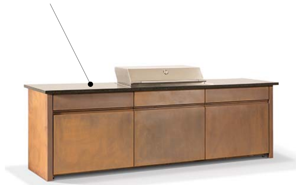
Gartenküche ELBA aus Cortenstahl mit Edelstahl-Gasgrill und drei Unterschränken

Arbeitsplatte aus schwarzem Granit Nero Assoluto, Oberfläche satiniert