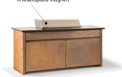
Gartenküche ELBA aus Cortenstahl mit Edelstahl-Gasgrill und zwei Unterschränken

Professioneller Einbau-Gasgrill aus Edelstahl, von oben bedienbar und in Arbeitsplatte integriert