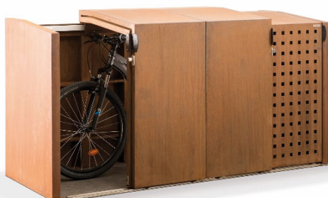
Mülltonnen- und Fahrradbox XANTEN mit 4 Schiebetüren – als Fahrradbox