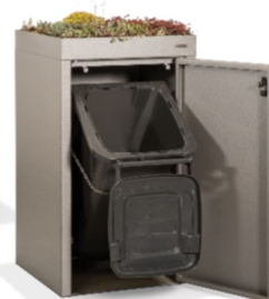
Mülltonnenbox ZITTAU in farbbeschichtet nach RAL/DB mit begrünbarem Pflanzdach