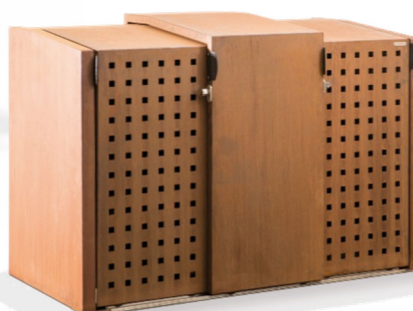
Mülltonnen- und Fahrradbox XANTEN mit 3 Schiebetüren