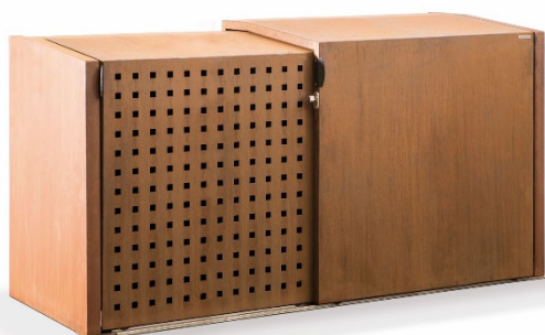
Mülltonnen- und Fahrradbox XANTEN mit 2 Schiebetüren