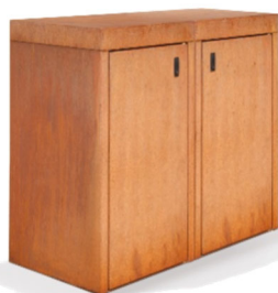
Mülltonnenbox ZITTAU in Cortenstahl für 120 l, 140 l und 240 l Mülltonnen