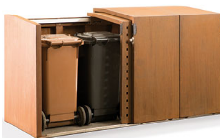
Mülltonnen- und Fahrradbox XANTEN mit 4 Schiebetüren – als Mülltonnenbox