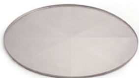
Untersetzer rund zum Schutz der Terrasse vor Rostpartikeln.