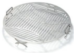
Grillrost massiv, mit Griffen und Stellfüßen – verschiedene Modelle für die verschiedenen Feuerstellen.