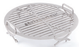
Grillrost für Grillring, für Feuerstelle TROJA.