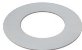
Grillring rund zum indirekten Grillen, für Feuerstelle TROJA.